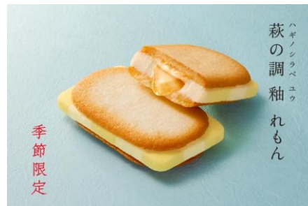
萩の調 釉 れもん