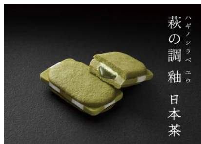
萩の調 釉 日本茶