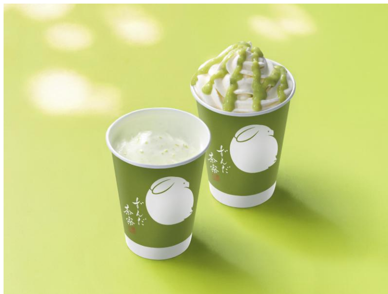
ずんだシェイク / ずんだシェイク エクセラ

普段は限られた店舗でしか味わえない一杯を、ご搭乗前後のリラックスタイムにぜひお楽しみください。