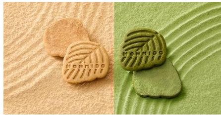
本実堂ほろほろクッキー