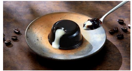
(季節限定商品) 本実堂コーヒーゼリー