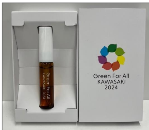
蒸留した柑橘の精油とブレンドした アロマスプレー製作