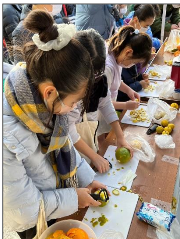
香り・味覚を楽しむ 川崎市産の柑橘の皮むき体験