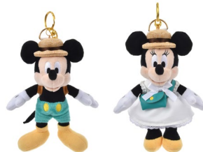
ぬいぐるみ キーホルダー