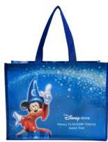
ショッピングバッグ