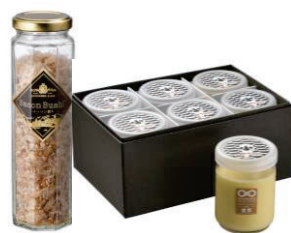
「北のハイグレード食品」各種