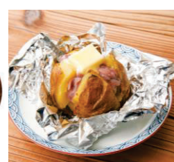
塩辛じゃがバター