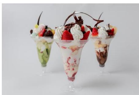
フルーツパフェ 1,500円～