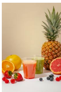
フルーツスムージー600円～

当店は、フード・ドリンクともに国産食材と無添加にこだわっており、国産フルーツをたっぷり使った「フレッシュフルーツパフェ」や「パンケーキ」などのスイーツをお楽しみいただけます。他にも、リキュールを使用せず、新鮮なフルーツや野菜、ハーブ、スパイスなど自然な材料をアルコールと組み合わせ、素材そのもののおいしさを楽しむカクテルの新スタイル「ミクソロジーカクテル」なども提供しています。また、彩り鮮やかな野菜たっぷりのプリトーや自家製カルツォーネなどのクイックフードメニューもご用意しています。ぜひ、「AGRO@フルーツパーラー」で空の旅の前に美味しい食事と素敵な時間をお過ごしください。