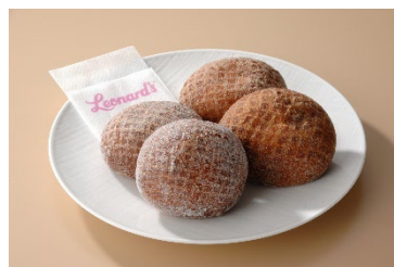
Leonard's Bakery レナーズ・ベーカリー ※第1ターミナルのみ販売