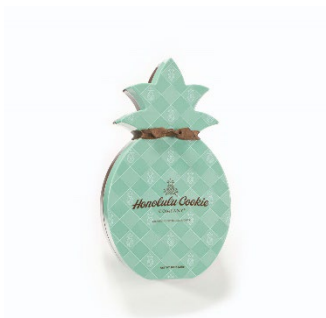
Honolulu Cookie Company ホノルル・クッキー・カンパニー