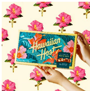
Hawaiian Host ハワイアンホスト