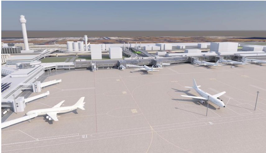
増築部 外観(イメージ)

日本空港ビルデング株式会社は、本年4月1日より、羽田空港第2ターミナルで、本館と北側サテライトを接続する整備工事に着手いたしました。