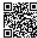
「かごしま農業女子プロジェクト」 Instagram