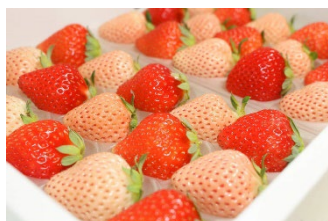
熊本県産苺化粧箱