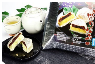
熊本名物いきなり団子