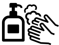
手洗い・手指消毒