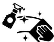
テーブル・椅子の消毒