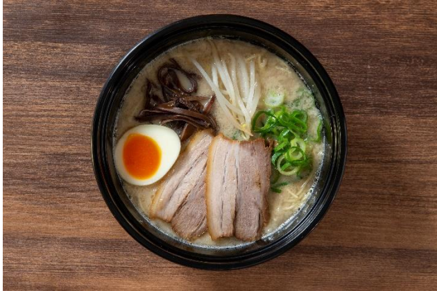
「一風堂 博多とんこつラーメン」