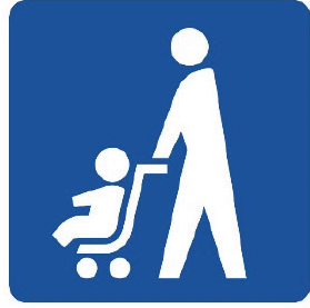
ベビーカーマーク

ベビーカー使用者が安心して利用できる場所や設備（エレベーター、鉄道やバスの車両スペース等）を表しています。