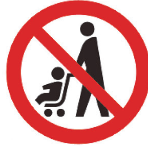
ベビーカー使用禁止マーク

ベビーカー使用者が安心して利用できる場所や設備（エレベーター、鉄道やバスの車両スペース等）を表しています。