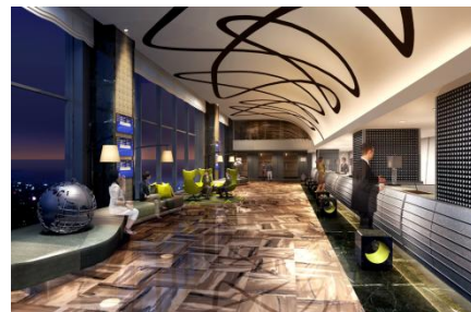
（フロント・ロビー）