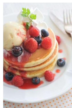
パンケーキ「フルーツミックス」 1,050円