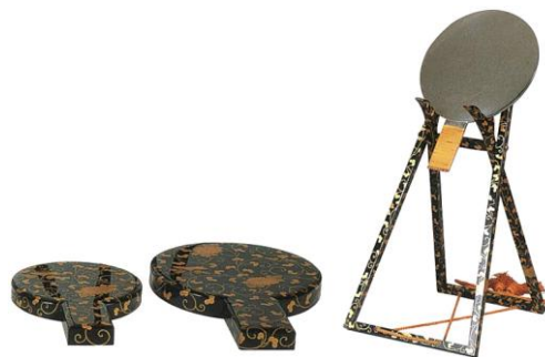
きくからくさま きえかがみや かかみだて 菊唐草蒔絵鏡家・鏡建

ガラシャ直筆の書状。三男・光千代を指すと思われる「みつ」が息災であることが綴られ、病弱な息子を思う母の心が感じられる。実名の「たま」を表す「た」の署名がある。