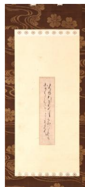
和歌短冊「たつね行」

細川忠興所用の麻の衣服で、箱書から妻・ガラシャの手織手縫の作とわかる。露払は鎧の上からはおった表着ではないかとの説があり、その名称からも雨具であると考えられる。