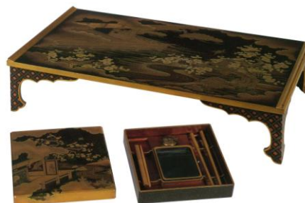
はつねまきえぶんたい すずりばこ 初音蒔絵文台・硯箱

『源氏物語』写本とそれらを収める蒔絵筆筒。教養は重要な嫁入り道具と考えられ、特に『源氏物語』は武家社会で重視された。筆筒の引出には各帖の巻名が金字で書かれている。