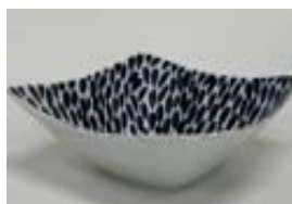
スクエアボウル葉