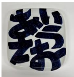
角丸大 あいうえお